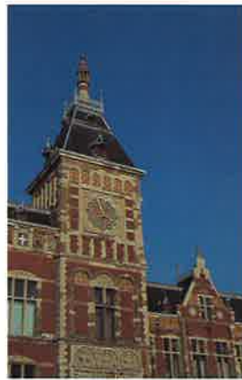
Centraal Station Amsterdam: het materiaal als schilderkunstig medium

beter voorbeeld van de eenzijdige belangstelling voor 'textuurloze' materialen. Of het moet de saaie monotone herhaling van uniekleurige bakstenen en strakke platvolle grijze voegen in veel hedendaagse sociale woningbouw zijn. Het zelfde proces van verschraling in het benutten van de expressiemogelijkheden van materialen en detaillering is ook zichtbaar in het vervangen van geprofileerde houten raamkozijnen door platte kunststofelementen. De speelse effecten die door het zonlicht kunnen worden opgeroepen, zijn daarmee opgeofferd aan de veronderstelde onderhoudsbesparing. Het zijn de