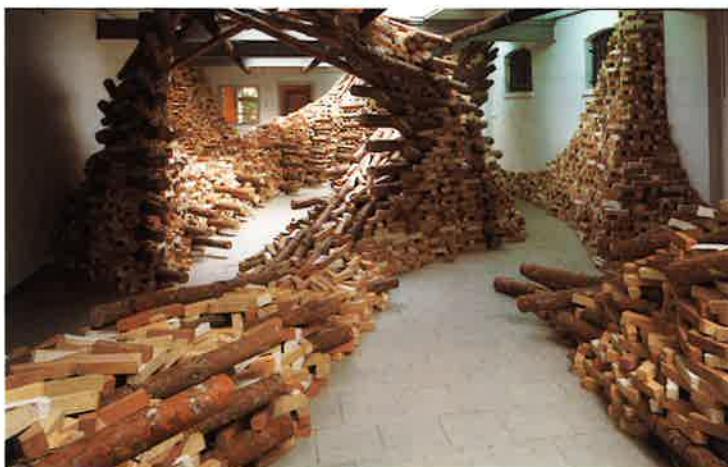
Stapelwerk van Takamasa Kuniyasu

woonconsumenten als tweeverdieners, 45-plussers, gezin met twee kinderen, gezin met oudere kinderen, senioren, vrij gevestigden, dinks ('double income no kids') enzovoort. Zelfs met de opeenvolgende fasen van de 'wooncarrière' van de consument wordt rekening gehouden. Ook de omschrijvingen van de projecten zijn een staalkaart van de tijdgeest, met speciale aandacht voor: vrije indelingsmogelijkheden, flexibiliteit, uitwisselbaarheid van functies en natuurlijke vormen en materialen. Bovendien is er sprake van nieuwe woonthema's, zoals mag blijken uit de typologie: solitaire individuele woningen . Tijdens de NWR-BouwRai is de buitenexpositie te bezichtigen, waarbij diverse projecten ook van binnen bekeken kunnen worden. De toegangsprijs bedraagt f 25,-. ■