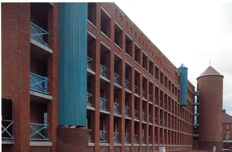
Het Fort (Kokon)