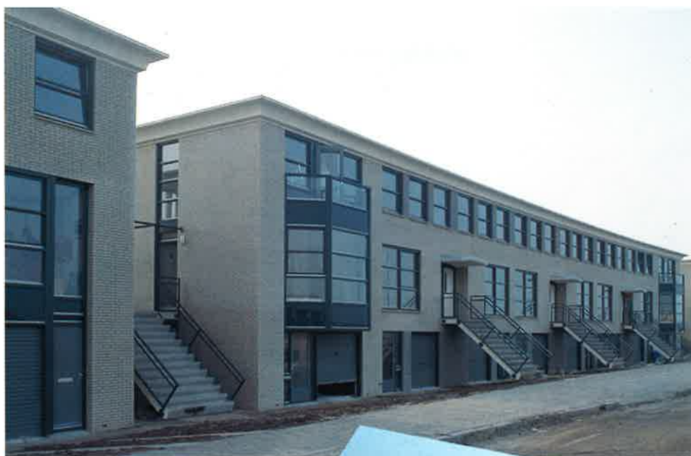
Grachtenpanden of Ringwoningen (Architectenbureau Inbo)