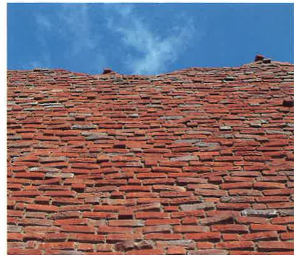
Ruïne-woningen: illusie door ruw en ongelijk oppervlak

Architecten van de Amsterdamse School bouwden hun eerste werken als organische sculpturen; soms werden zij geïnspireerd door een antroposofische levensovertuiging. De kleur en plastische eigenschappen van hun bouwmaterialen werden expressief en ten volle benut. Baksteenfabrikanten kregen precies opgegeven in welke vorm en structuur hun stenen waren gewenst. Door afwisseling in kleur, vorm, stapeling en door afwisseling in platvolle of diep uitgespaarde voegen werkte het organisch gevormde bouwomhulsel daadwerkelijk als een haast levende tastbare huid, waarop het zonlicht telkens wisselende effecten te zien gaf.