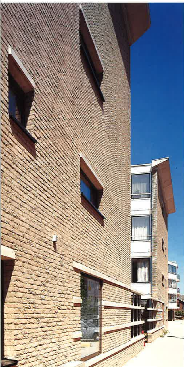
Woningwetwoningen van Rudy Uytenhaak: robuust metselwerk

niet-dragende delen glad of glimmend te maken, ontstaat een optische illusie van enerzijds kracht en zwaarte en anderzijds lichtheid. In de hedendaagse architectuur wordt de illusie van zwaarte en kracht door gebruikmaking van textuur nauwelijks toegepast. Dat geldt ook voor textuurcontrasten. De nadruk is steeds meer komen te liggen op de uniformiteit en homogeniteit van het gebouw. Architecten van het Nieuwe Bouwen streefden zelfs naar een algehele immateriële en zwevende verschijningskarakteristiek. Elke onregelmatigheid of kleurafwijking zou het homogene en zwevende karakter kunnen ontcrachten. Deze visie heeft onder andere tot gevolg gehad dat de toeleverende industrie lange tijd haar producten op deze vraag heeft afgestemd.