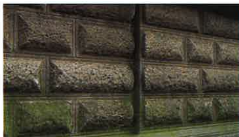
Ruw behakte structuur: illusie van kracht en zwaarte

Er moet opnieuw aandacht komen voor de fundamentele eigenschappen van kleur, vorm en oppervlaktekwaliteit van bouwmaterialen. De architectuur is gediend met een grote verscheidenheid in de behandeling van oppervlakten. Juist in de trefzekere combinatie van kleur en textuur, het vermogen kortom, om de effecten daarvan te sturen,