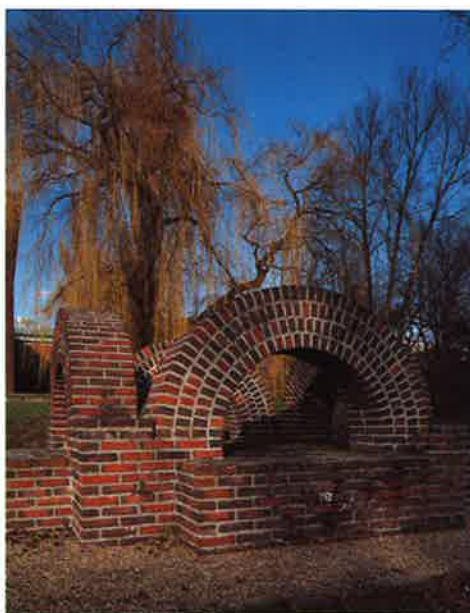
Per Kirkeby, baksteensculptuur Museum Boymans-Van Beuningen, Rotterdam

met baksteen hebben gewerkt; het is echter slechts een enkeling die dit materiaal tot een soort systematisch uitgangspunt heeft verheven. Het lijkt vooral een toevallige aangelegenheid: zoals er kunstenaars zijn die werken met vet (Joseph Beuys), zoals er kunstenaars zijn die vliegtuigen ontwerpen (de Belg Panaramenko), en zoals sommige kunstenaars zichzelf tentoonstellen (het Engelse duo Gilbert and George), zo zijn er toevallig ook kunstenaars die een tas stenen en een trom-