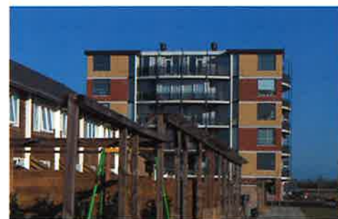
Stadsvilla's in Zuiderpolder: nieuwe kleurimpressies

Het T.N.O.-gebouw in Delft bestaat uit een omhulling van groene, geglazuurde bakste-