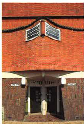
Amsterdamse School: materiaal werkt als levende huid

De onderschatting of miskenning van de rol van kleur en textuur in architectuur is onder andere af te lezen aan de recente overdaad aan spiegelende kantoorgebouwen. Er is geen