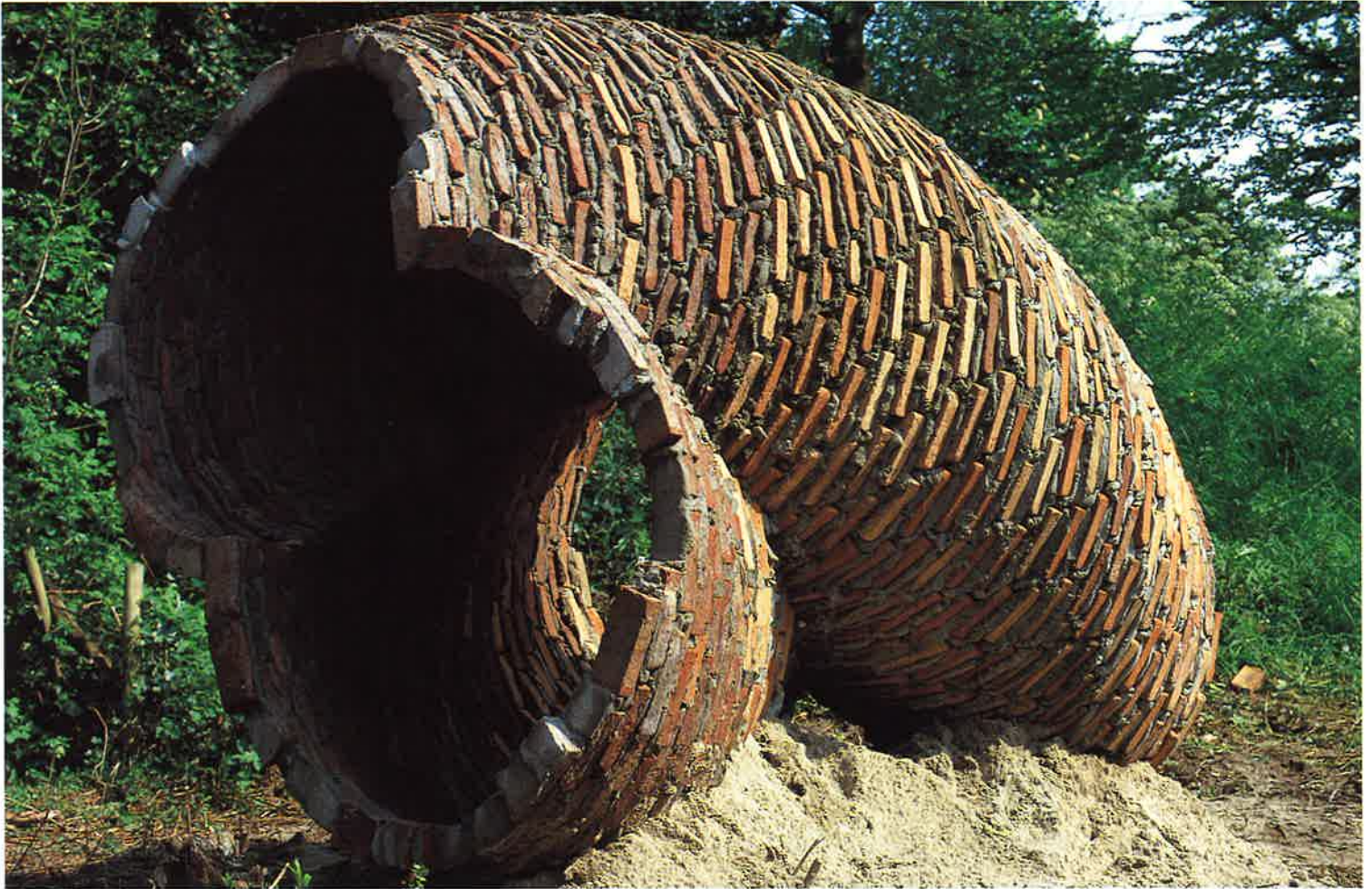
Herman Makkeink: koker, Amsterdam

een reeks reusachtige onderkinnen en met een sombere oogopslag die weinig te raden overlaat. Aan de voet van de vestingmuur zie je een aantal soldaten te paard, die in een gevecht zijn verwickeld. De impressie die het schilderij oproept is er een van onherbergzaamheid, van naderend onheil, en van een algehele gewelddadigheid.